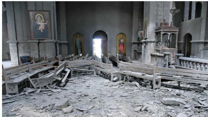
Շուշիի Ղազանչեցոց Ս. Աննափրկիչ եկեղեցին՝ հոյժիրակոծուած ատրպէյջանական զինուժին կողմէ, 8 հոկտ. 2020 թ.

Քրիստոնէական ընկալումով՝ Ս. Ծնունդը յոյսի, սիրոյ, խաղաղութեան եւ մարդկութեան հանդէպ Աստուծոյ անընդմիջելի մերձակայութեան տօնն է: Աւետարանի այս պատգամը, սակայն, բազմիցս կտրուկ կը հակադրուի պատմական եղելութիւններուն, պետութիւններու որդեգրած քաղաքական իրականութեան ու անկէ թելադրուած դիւանագիտական գործողութիւններուն: Այս հակասութիւնը յատկապէս ակնյայտ կը դառնայ այն պարագային, երբ քրիստոնէական կրօնին ու մշակոյթին պատկանող ազգեր ուղղակի կը դառնան բռնութեան, տեղահանութեան, իրաւագրկութեան, ընդհուպ մինչեւ իսկ ցեղասպանութեան զոհ, երբ միաժամանակ դիտումնաւոր կը լքուին նոյն հաւատքը դաւանող՝ այսպէս կոչուած քրիստոնէայ ազգերու եւ պետութիւններու կողմէ: Այս փաստը առաւել եւս հիապօստութիւն կը պատճառէ, երբ անոնք ունին բոլոր հնարաւորութիւնները օժանդակելու իրենց հաւատակից քոյրերուն ու եղբայրներուն՝ առնուազն կանխարգիլելու անոնց սպառնացող օրհասական վտանգը: