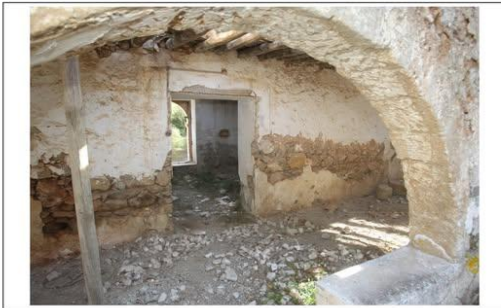
The Armenian monastery of Sourp Magar, occupied Halevga To Armenoμονάστηρο (Μονή Αγίου Μακαρίου), κατεχόμενη Χαλεύκα Sourp Magar Ermeni Manastırı, işgal altındaki Alevkayası'nda Սուրբ Մակարայ Վանքը, գրավեալ Հալէֆքա

KÜLTÜR TRAJEDİSİNE DİKKAT: KIBRIS'TAKİ TEK ERMENİ MANASTIRI TAMAMEN YÜK OLMANIN ESİĞİNDE!